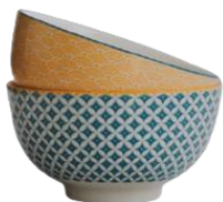
จานชามเซรามิก