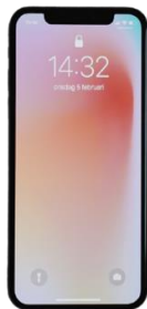
สินค้าแตกหักง่าย

ตัวอย่างที่ 2: โทรศัพท์มือถือ + เคสมือถือ