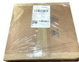
ติดเทปหุ้มพัสดุ