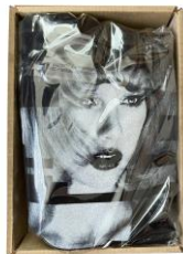
กล่องขนาดเหมาะสม