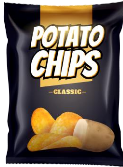
สินค้าที่อาจแตกหัก / เสียหายได้

ตัวอย่างที่ 3: ขนมกรุบกรอบ + เครื่องดื่มบรรจุขวด