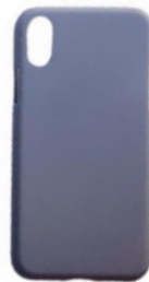
สินค้าที่อาจแตกหัก / เสียหายได้

ในการแพ็คเกจสินค้า ต้องทำตามแนวทางการแพ็คเกจสินค้าประเภทสินค้าแตกหักง่าย เนื่องจากโทรศัพท์มือถือมีโอกาสได้รับความเสียหายมากกว่า