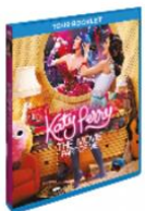
อัลบั้มเพลง