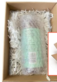
ใส่วัสดุกันกระแทกเพียงพอ