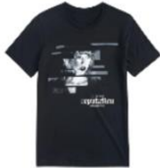
สินค้าไม่แตกหัก