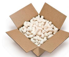
ใส่วัสดุกันกระแทกเพียงพอ