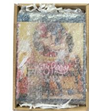
กล่องขนาดเหมาะสม