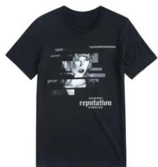
เสื้อยืด