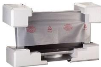
ใส่โฟมป้องกันการเคลื่อนที่