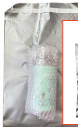
ช่องพัสดุขนาดเหมาะสม