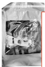
ซองพัสดุขนาดเหมาะสม