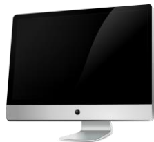
จอคอมพิวเตอร์