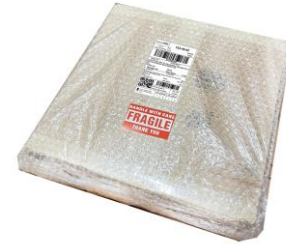
ติดเทปห่อหุ้มพัสดุ / ติดป้ายเตือน