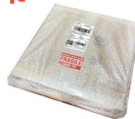
ติดเทปห่อหุ้มพัสดุ / ติดป้ายเตือน