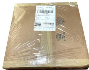
ติดเทปห่อหุ้มพัสดุ