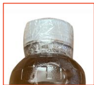
ล็อกฝาปิดอย่างแน่นหนา