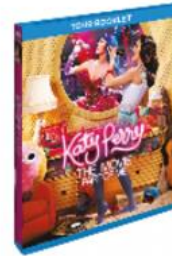
สินค้าที่อาจแตกหัก / เสียหายได้

ในการแพ็คสินค้า ต้องทำตามแนวทางการแพ็คสินค้าประเภทสินค้าที่อาจแตกหัก / เสียหายได้ เนื่องจากอัลบั้มเพลงมีโอกาสได้รับความเสียหายมากกว่า