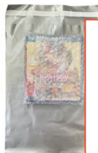
ซองพัสดุขนาดเหมาะสม