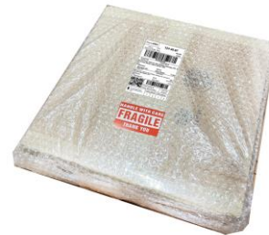
ติดเทปห่อหุ้มพัสดุ ติดป้ายเตือน