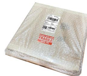
ติดเทปห่อหุ้มพัสดุ / ติดป้ายเตือน