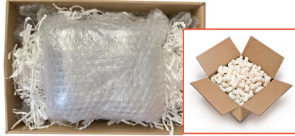
ห่อและใส่วัสดุกันกระแทกเพียงพอ