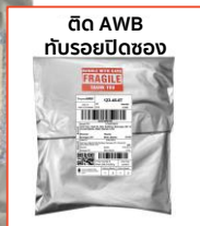
ช่องพัสดุขนาดเหมาะสม