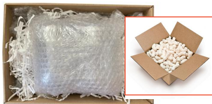
ห่อและใส่วัสดุกันกระแทกเพียงพอ